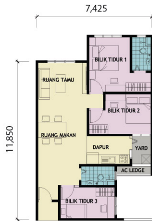
UNIT JENIS C1 - 800KPS