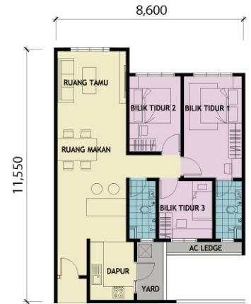
UNIT JENIS C2 - 900KPS