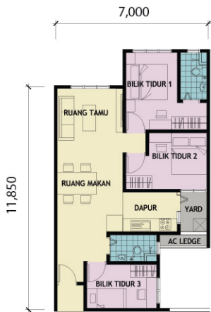
UNIT JENIS B - 750KPS