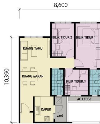
UNIT JENIS C1A - 800KPS